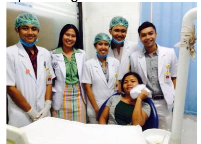
↑ This is 2 nd open method (I and my team with our instructor)