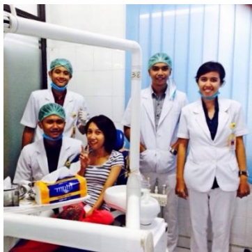
← This is 1 st open method , many stories, Many sweats, many tears from the patient Until we have done the open method, we take out the residual root of tooth, before we take the photo patient feel pain, my patient say "peace hahaha", after we say "okay now we take photo"

This is my story in oral surgery and pedodontic: From December until March I have practice in oral surgery department and pedodontic (dentist for child) department. I start my story from oral surgery, I must finish many cases in this department like exodontia 15 teeth, chronic abscess (diagnosis and treatment), acute patient and odontectomy. This is story about my acute patient, he comes with big check (asymmetric face) that very painful. And he can't speak not cause toothache but he can't speak from born (dumb), before I give a treatment I must have a dental record from the patient, I must ask many questions to the patient. He can't hear very well and can't answer with verbal, and so I must use body language to talk to patient and must have more imagination to understand what his say. When I check the tooth, that nice, I think this case not from tooth. And I must ask again to the patient what cause this case, and I find this is because he get stabbed fishbone. That need patience to handle the patient. And when I have open method (exo the tooth, must open the gums and after that take out the bone, and suture). This is some photos when I do the oral surgery: